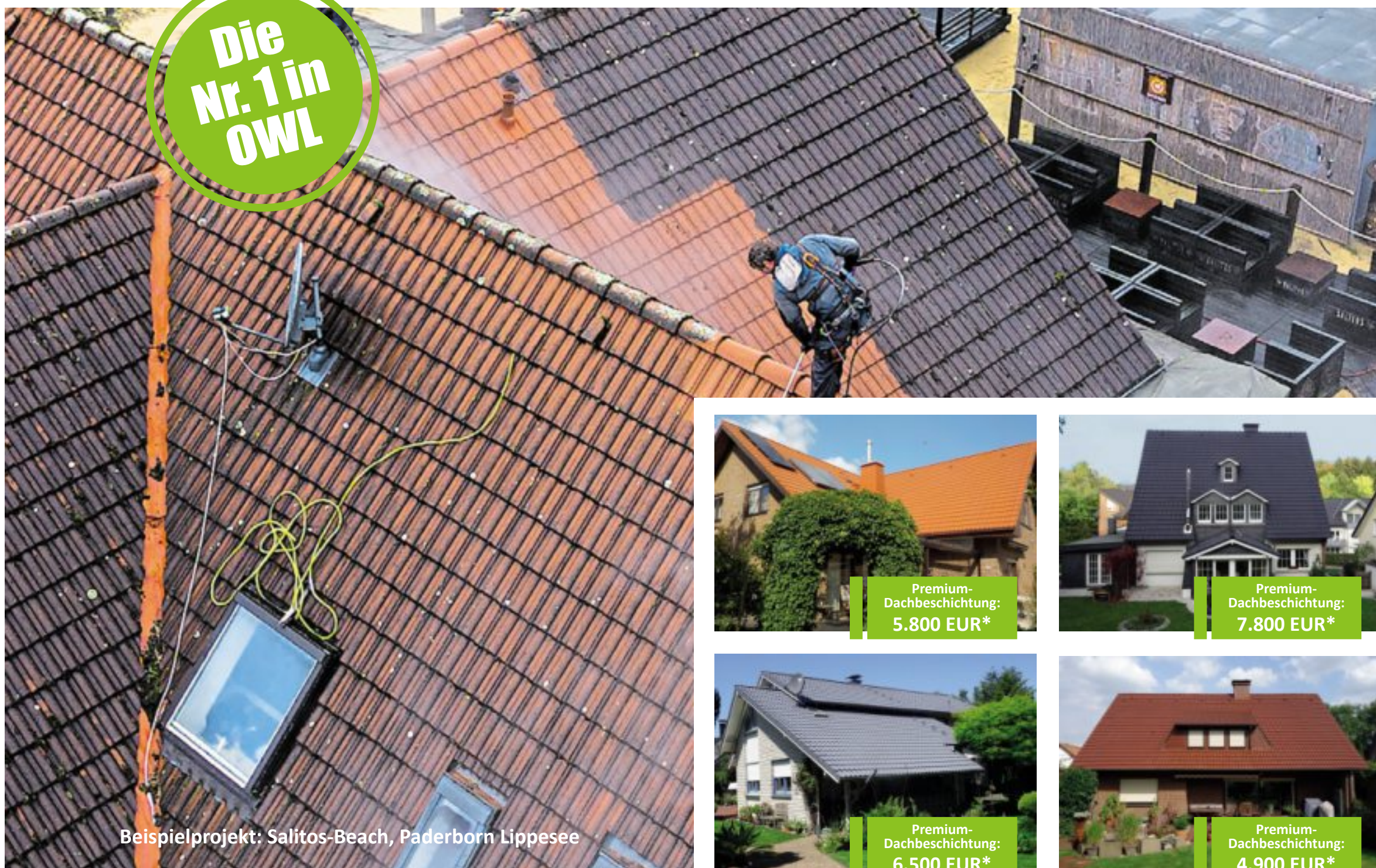
Beispielprojekt: Salitos-Beach, Paderborn Lippesee