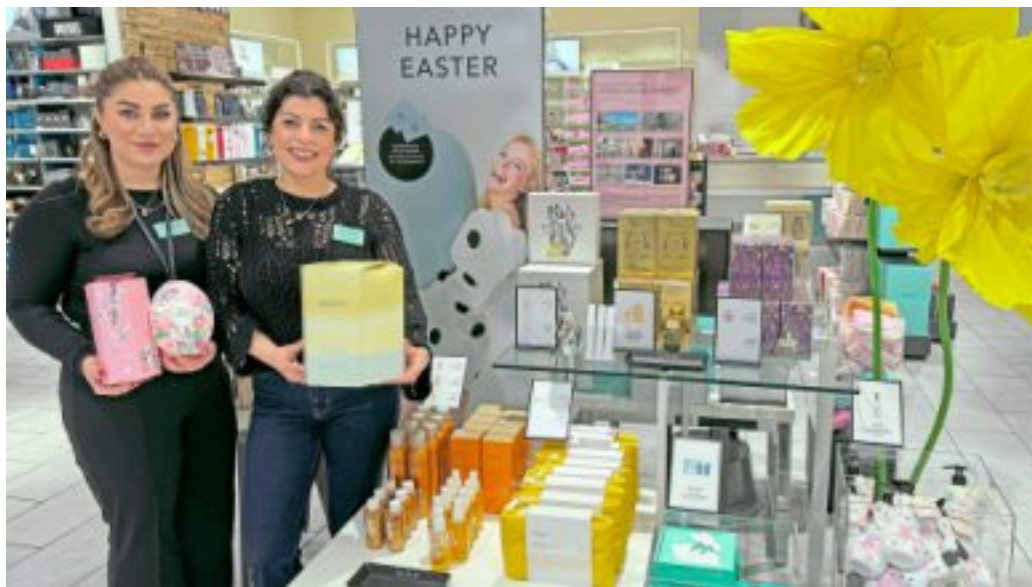
Das Team von Douglas im SÜDRING freut sich auf Ihren Besuch.

Das Team von Douglas im SÜDRING-Center freut sich darauf, Sie bei der Auswahl Ihrer ganz persönlichen Duftgeschenke zu beraten – für ein Osterfest voller kleiner Glücksmomente.